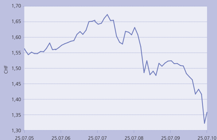
Entwicklung des Euros gegenüber dem CHF in den letzten fünf Jahren

Rohstoffe litten in den vergangenen Wochen unter der Wirtschaftsverlangsamung in China. Aus unserer Sicht ist dies aber ein eher kurzfristiger Effekt. Langfristig erwarten wir eine positive Entwicklung der Rohstoffpreise. So machen Rohstoffanlagen als Beimischung durchaus Sinn. ■