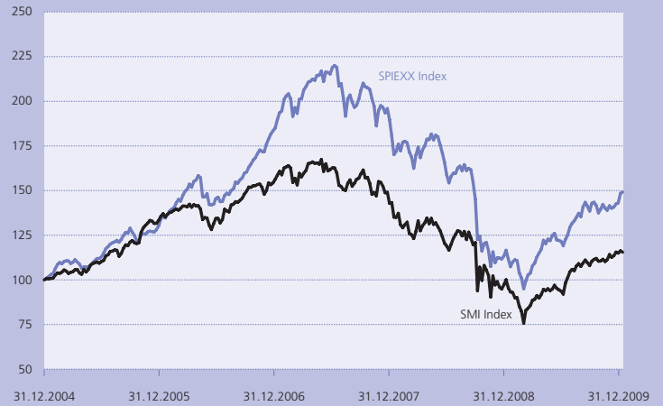
Evolution SPIEXX* – SMI (indexé)

* Le SPIEXX regroupe tous les titres du SPI à l'exception des blue chips suisses.