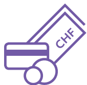
Zahlen & Sparen

Mit jeder Geschäftsphase tauchen auch neue Bedürfnisse auf – für Sie und Ihre Mitarbeitenden. Ob beim Zahlen, Sparen, Vorsorgen, Finanzieren oder Anlegen – Sie haben die Ziele und Bedürfnisse, wir die passenden Lösungen und Produkte.