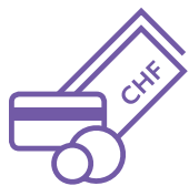
Paiements et épargne

Chaque phase commerciale génère de nouveaux besoins, pour vous comme pour vos collaboratrices et collaborateurs. Qu'il s'agisse de paiements, d'épargne, de prévoyance, de financements ou de placements, vous avez des objectifs et des besoins, nous avons les solutions et produits adaptés.